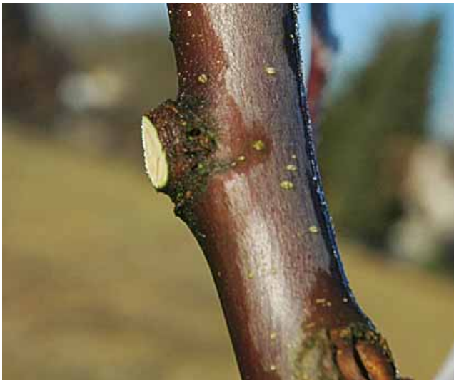
Triebe werden immer auf den sogenannten Astring geschnitten (oben: vor dem Schnitt, unten: nach dem Schnitt)