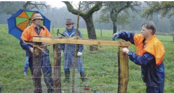
Verbisschutz mit einem Dreibock