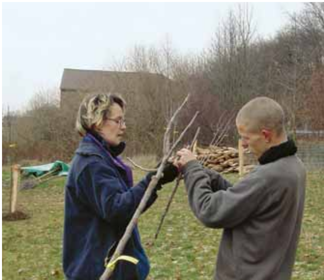
Der erste Schnitt des Obstbaumes erfolgt während der Pflanzung

Beim Pflanzschnitt lässt man 3 (-4) Leitäste und die Mittenverlängerung stehen. Alle anderen Austriebe werden abgeschnitten. Zuerst werden die Leitäste auf bis zu 1/5 ihrer Länge eingekürzt. Es muss darauf geachtet werden, dass das jeweilige obere Knospengauge nach außen zeigt. Die obersten Knospen aller Leitäste müssen auf einer Höhe liegen. Dabei kann ein Abspreizen oder Hochbinden einzelner Leitäste notwendig werden. Ideal sind annähernd unter 45 ° angewachsene Leitäste. Als letzter Trieb wird die Mittenverlängerung auf eine Handbreit oberhalb der Leitäste zurückgeschnitten.