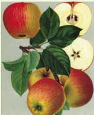
l.o.: Graue Herbstrenette, r.o.: Rheinischer Winterrambour, m.l.: Gravensteiner, m.r.: Jacob Lebel, u.l.: Rote Sternrenette, u.r.: Goldparmäne