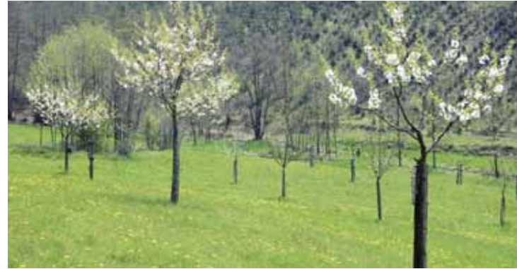
Obstbäume in der Jugendphase

In der Jugendphase muss bei Obstbäumen neben dem jährlichen Erziehungsschnitt der Krone die Baumscheibe (Wurzelbereich) freigehalten werden, da den Jungbäumen durch Konkurrenzbewuchs Nährstoffe und Wasser entzogen werden. Ein Aufbringen von Komposterde oder durchgerottetem Stallmist unterstützt das Wachstum.