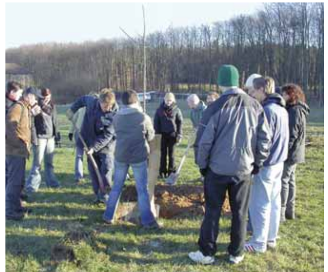
Eine sorgfältige, fachgerechte Pflanzung ist für Obstbäume wichtig

Frühjahrsplantungen in der frostfreien Zeit von März bis April leiden kaum unter Frostschäden. Dafür sind die im Frühjahr gepflanzten Bäume bei Trockenheit auf zusätzliche Bewässerung angewiesen.