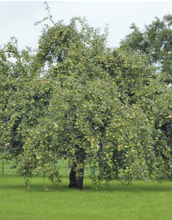
Großkronige Bäume entwickeln sich nur auf starkwüchsigen Unterlagen

Sowohl Halbstämme als auch Hochstämme entwickeln sich auf einer starkwüchsigen Unterlage zu großkronigen Bäumen. Typisch für Streuobstwiesen sind besonders robuste Sorten auf Hochstämmen. Eine Stammlänge von mindestens 180 cm gewährleistet eine extensive Nutzung des Unterwuchses als Wiese oder Weide. Bei Nachpflanzungen und Neuanlagen sollten deshalb ausschließlich Hochstämme gesetzt werden.