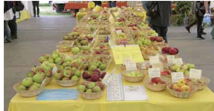
Die Sortenvielfalt der Streuobstwiesen wird auf zahlreichen Obstfesten präsentiert

Äpfel sind aufgrund ihrer Vitamin- und Mineralstoffgehalte das ideale Nahrungsmittel. Sie enthalten einen hohen Anteil an Ballaststoffen (Pektin), das den Cholesterinspiegel senken und Schadstoffe binden und ausschwemmen kann.