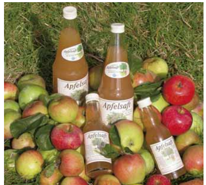
Streuobstwiesensaft in 0,2 Liter-Flaschen ist sehr beliebt in Kindergärten und Schulen

Viele Verbraucher sind gerne bereit, einen geringen Mehrpreis für Apfelsaft aus ungespritztem Obst der Streuobstwiesen zu zahlen. Insbesondere wenn ihnen vermittelt wird, dass sie damit auch zum Erhalt von Streuobstwiesen beitragen können. Zusätzliche Voraussetzung für dieses Marketing-Konzept sind vertragliche Regeln zwischen Kelterer und Obstlieferant, wobei der Verzicht auf chemisch-synthetische Pflanzenschutzmittel wichtig ist.