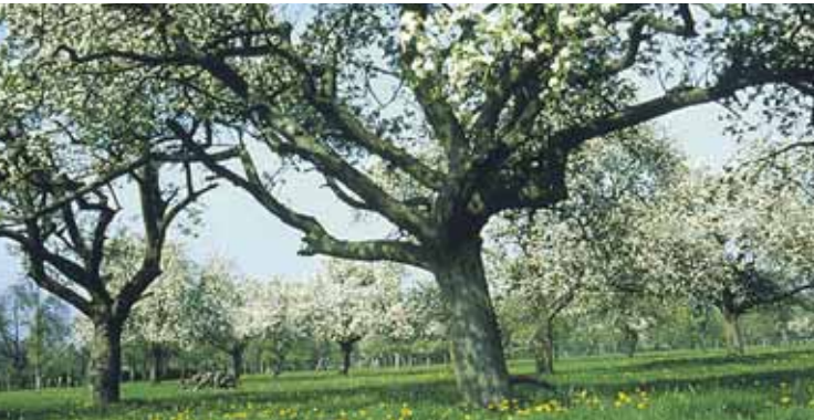
Obstbäume in der Altersphase

Mit Beginn der Altersphase bei Obstbäumen lässt das Wachstum aller Triebe stark nach und es werden nur noch schwache Fruchttriebe gebildet. Nahezu alle Leittriebe einschließlich der Stammverlängerung hängen stark nach unten, Blätter und Früchte bleiben klein und besonders im Kroneninneren sterben einzelne Astpartien und Zweige ab.