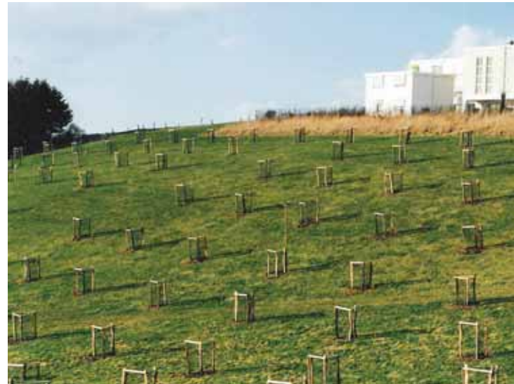
Eine Streuobstwiese als Ausgleich- und Ersatzmaßnahme

Die Adressen der genannten Stellen finden sich im Anhang.