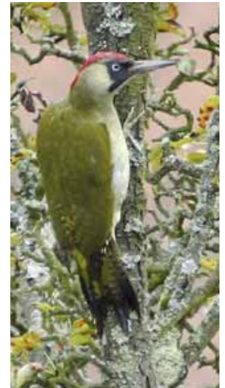
Streuobstwiesen sind für Höhlenbewohner wie dem Grünspecht von großer Bedeutung