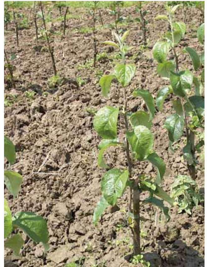
Die Unterlage entscheidet u.a. über die Wuchsstärke des künftigen Baumes

Für eine kräftige Verwurzelung und eine vitale Entwicklung von Obstbäumen ist hochwertiges Pflanzmaterial wichtig. Es ist ratsam, zertifizierte Obstgehölze in Baumschulen zu kaufen, die ihre Obstbäume selbst heranziehen unter Beachtung der Qualitätsrichtlinien des Bundes deutscher Baumschulen (BdB) bzw. Deutscher Markenbaumschulen.