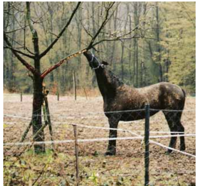
Baumschäden durch Pferdeverbiss

Die Baumscheibe muss regelmäßig freigehalten werden, damit die Stämme nicht zuwachsen und durch die Feuchtigkeit anfälliger für Pilzbefall werden.