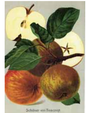
Im 19. und Anfang des 20. Jahrhunderts entstanden zahlreiche Obstsortenwerke, die in Bebilderung und kunstvoller Darstellung auch heute noch unübertroffen sind.

Nach dem 2. Weltkrieg ging die betriebswirtschaftliche Bedeutung der Streuobstwiesen zurück. Landwirtschaft und Obstbau wurden eigenständige Betriebszweige und der Obstbau konzentrierte sich in intensiv gepflegten Niederstamm-Plantagen.