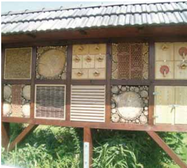
Insekten-Nistwand auf Streuobstwiese

0,5 % oder 18.000 Hektar der Landesfläche Nordrhein-Westfalens tragen Streuobstwiesen. Mit bis zu 3000 Tier- und Pflanzenarten zählen sie zu den artenreichsten Lebensräumen und haben eine große Bedeutung für die biologische Vielfalt unseres Bundeslandes.