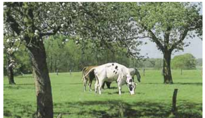
Streuobstwiesen benötigen eine Unternutzung durch Beweidung oder Mahd

Erst im 18. und verstärkt im 19. Jahrhundert erlebte der Obstbau seinen Aufschwung. Dieser äußerte sich in der staatlichen Förderung und Gesetzgebung, der Anlage von Baumschulen, Bepflanzung von Allmendeflächen sowie Obstpflanzungen auf Gütern und an Straßen.