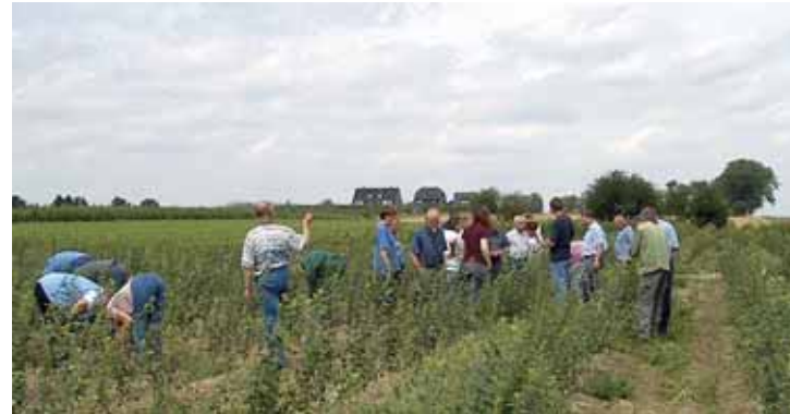
Frisch veredelte Obstgehölze

„Wenn ich wüsste, dass morgen die Welt untergeht, würde ich heute noch ein Apfelbäumchen pflanzen.“ (Martin Luther)