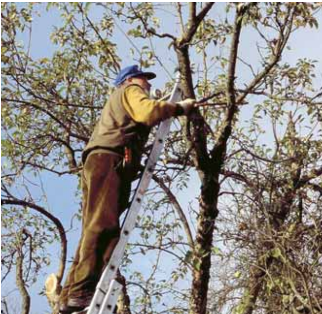
Bei nachlassenden Erträgen ist zur Bildung neuen Fruchtholzes oft auch ein Rückschnitt stärkerer Äste zur Verjüngung erforderlich

Im nächsten Schritt wird die obere Leitästegalerie auf schwächeres Holz abgeleitet und dabei gekürzt. Danach werden die unteren Leitäste durch Ableitung auf schwächere Triebe eingekürzt. Die Geometrie der Altbaumkrone muss dabei bewahrt bleiben. Auf diese Weise wird Neuaustrieb am ganzen Baum angeregt. Weitere Maßnahmen der Altbaumbehandlung sind das Entfernen von Totholz, von alten Wasserschossen an Stamm- und Leitästen und das Nachschneiden vorhandener Astbrüche.