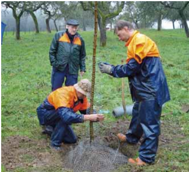
Um die Wurzeln vor Wühlmausverbiss zu schützen, wird der Baum in einen Drahtkorb gepflanzt

Die Veredlungsstelle muss am Ende eine Hand breit über der Geländeoberfläche liegen. Wenn die Veredlungsstelle in die Erde gebracht wird, stößt die Unterlage die Sorte ab. Dadurch wird verhindert, dass die Veredlung bzw. der Stammbildner selbst Wurzeln bilden. Während eine Person das Loch mit Erde füllt, sollte die andere Person den Baum in Position halten und ihn dabei vorsichtig rütteln. Durch das Rütteln des Baumes, das laufende, vorsichtige Antreten der Erde und das spätere Wässern sorgt man für guten Bodenkontakt mit den Wurzeln. Hohlräume zwischen Wurzeln und Erde sollten vermieden werden.