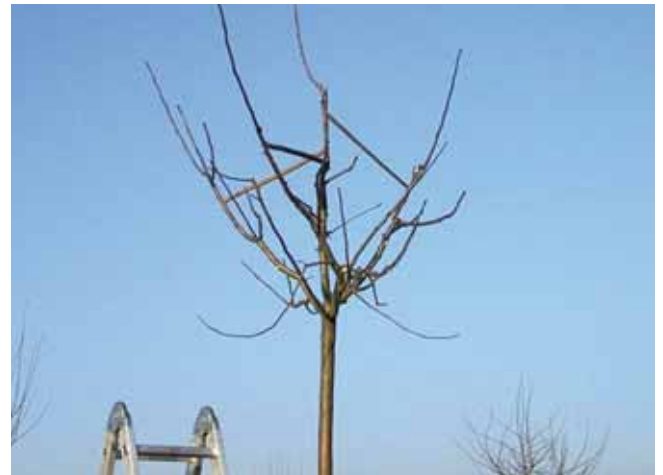
Für einen stabilen Kronenaufbau müssen Obstbäume frühzeitig mit Hölzern gespreizt werden