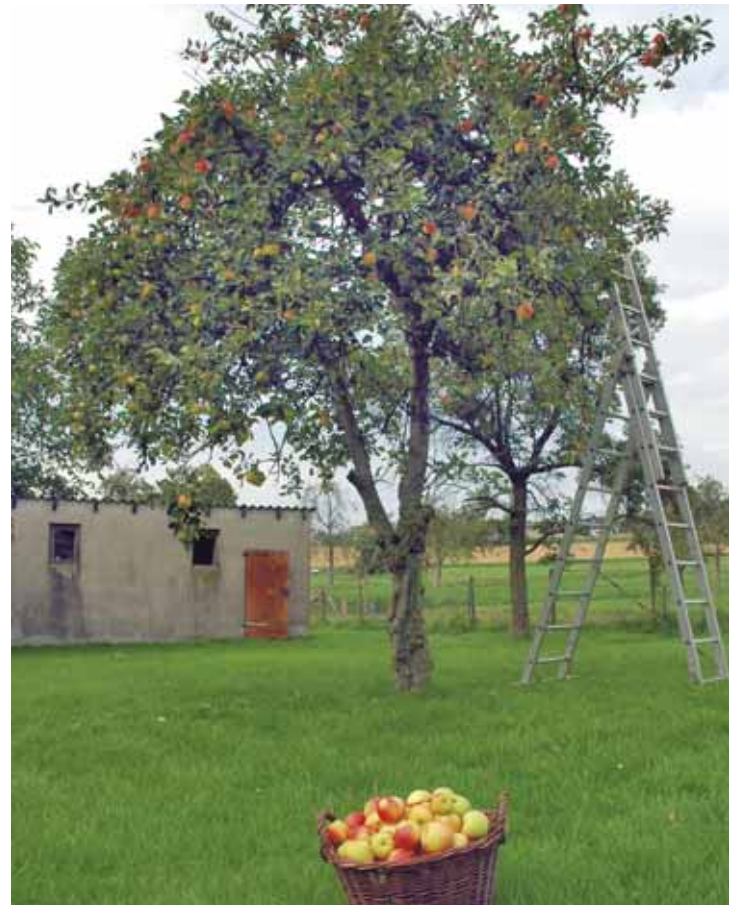
Für eine gute Ernte sind regelmäßige Schnittmaßnahmen notwendig

Der günstigste Zeitpunkt für umfangreichere Schnittmaßnahmen an älteren Kernobstbäumen ist der Spätwinter von Februar bis März. Keinesfalls wird bei strengem Frost geschnitten. In der Zeit von Juli bis August müssen diese Bäume kontrolliert werden und ergänzende, triebbremsende Schnittmaßnahmen zur Kronenkorrektur vorgenommen werden (Sommerschnitt). Stammaustriebe und Wasserschosse werden entfernt. Bei Pflaumen und Kirschen wird der Auslichtungs- und Verjüngungsschnitt schon im Sommer unmittelbar nach der Ernte durchgeführt.