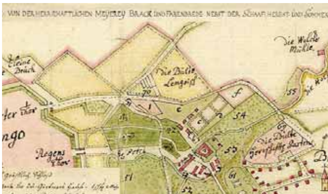
Auf einer Karte von Lemgo aus dem Jahr 1778 sind zwei Bauernhöfe mit Obstwiesen eingezeichnet

Noch bis 1945 waren die hochstämmigen Streuobstwiesen der landwirtschaftlichen Betriebe die Basis für die Obsterzeugung, dienten der Bevölkerung zur Selbstversorgung und belieferten die örtlichen Märkte.