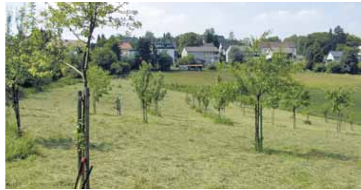
Für eine optimale Entwicklung der Streuobstwiese dürfen die Bäume nicht zu dicht stehen!

Bei der Randbepflanzung sind die nachbarschaftsrechtlichen Grenzabstände unbedingt einzuhalten (Bürgerliches Gesetzbuch und Nachbarrechtsgesetz NRW).