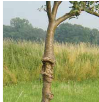
Eine fehlerhafte Anbindung kann zu starken Schäden, wie Einschnürungen am Baum, führen.

Hierzu wird das Drahtstück um den Stamm gelegt und die Ränder zusammengebogen. Es entsteht eine etwa 20 cm durchmessende, bewegliche Röhre. Diese wird am oberen Ende an einer Stelle so zusammengedrückt, dass sie am Stamm anliegt. Auf diese Art und Weise macht sie jede Bewegung des Baumes mit. Es entstehen keine Scheuerstellen.