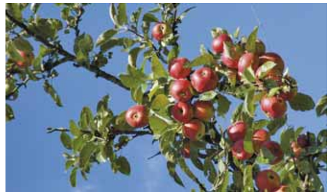
Ein vollaromatischer, vitaminreicher Apfelsaft ist ein schmackhaftes Produkt des Streuobstanbaus

Bei unseren Hochstämmen setzen etwa ab dem 7- bis 12. Standjahr die Obsterträge ein. Im Vollertrag können jährlich teils mehr als 500 Kilogramm Früchte pro Baum geerntet werden.