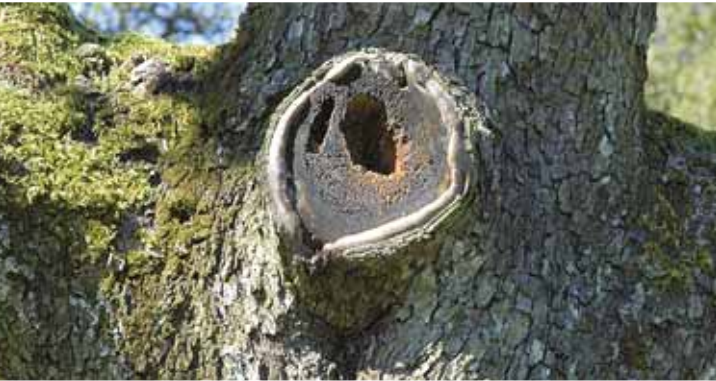
Alte Bäume können sehr höhlenreich sein

auch die häufige Einbindung in die umgebende Strukturvielfalt bestehend aus Bauernhöfen, halboffenen Feldfluren, Wegen, Teichen, Alleen und Hecken positiv aus.