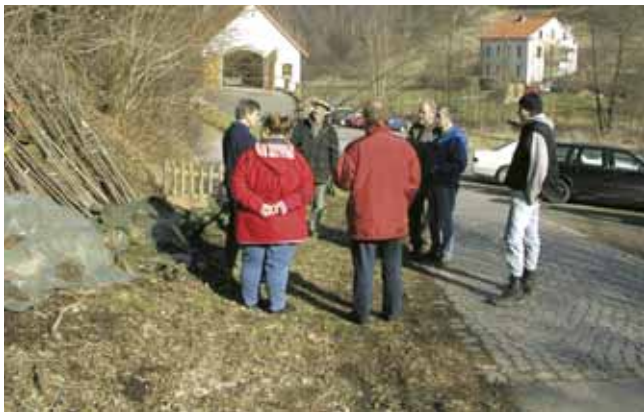
Pflanzaktion, links im Bild: Pflanzgut im Einschlag

Der Transport der Obstbäume sollte so terminiert werden, dass unmittelbar nach der Ankunft gepflanzt werden kann. Ansonsten können die Gehölze schräg in Erde „eingeschlagen“ werden. Wenn die Wurzeln dabei mit Boden bedeckt und ausreichend feucht gehalten werden, kann der Baum auch eine überraschende Kälteperiode überstehen. Die Bäume sind im Einschlag vor Wild- und Mäuseverbiss zu schützen. Dennoch: Je kürzer die Einschlagzeit, desto höher die Anwachsrate.