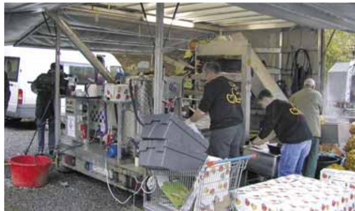
Mobile Kelterei in Aktion

Mobile Saftpressen bieten ein zusätzliches Angebot zu den vorhandenen Fruchtsaft-Keltereien. Sie eröffnen den Obstanlieferern die Möglichkeit, den Saft aus ihren eigenen Äpfeln wieder mitzunehmen und stellen ihre Dienste Eigentümern großer Obstwiesen oder Vereinen auch vor Ort zur Verfügung. Kontaktadressen finden sich im Anhang.