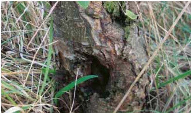
Der von Baumkrebs befallene Jungbaum ist nicht mehr zu retten. Die Gefahr der Pilzkrankung ist bei zugewachsenen Baumscheiben besonders hoch.

Ideal ist in den ersten Jahren eine jährliche Gabe von Kompost oder gut verrottetem Stallmist. Außerdem sollte darauf geachtet werden, dass im Stammbereich (Baumscheibe) das Gras nicht zuwächst und mit dem Baum um Wasser und Nährstoffe konkurriert.