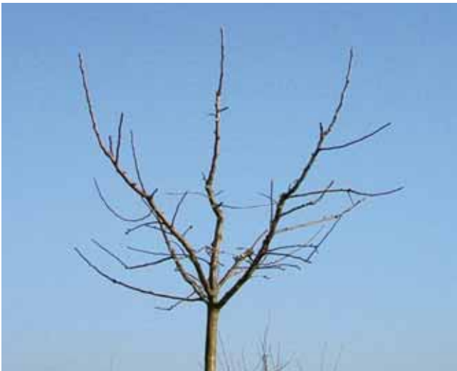
Baumkrone vor und nach dem Erziehungsschnitt

Nicht alle Obstbäume entsprechen in ihrem Wachstum den Beschreibungen der Fachliteratur. Das häufigste Problem sind zu steile oder zu flache Seitenleitäste. Spreizhölzer bringen die Äste in den günstigen Winkel. Sie können aber auch hochgebunden werden.