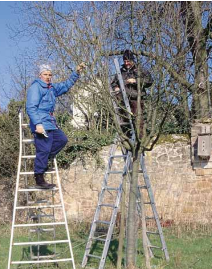
Der Überwachungs- oder Erhaltungsschnitt sollte alle 3 bis 5 Jahre durchgeführt werden

Der Erhaltungsschnitt sorgt für eine ausreichende Durchlüftung der Krone und beugt damit einem Pilzbefall (Krebs, Schorf, Birnengitterrost u. a.) vor. Sonnenlicht sollte immer bis in das Kroneninnere dringen können, und bei einem Blick in die Krone sollten Mittelachse und Leitäste klar erkennbar sein.