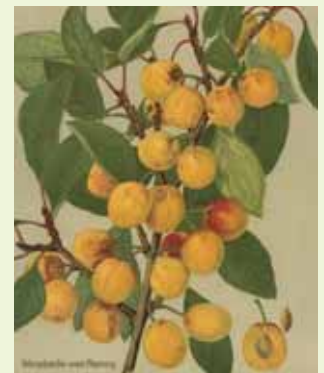
l.o.: Prinzessin Marianne, r.o.: Doppelte Phillipsbirne, m.l.: Alexander Lukas, m.r.: Gellerts Butterbirne, u.l.: Hauszwetschge, u.r.: Mirabelle von Nancy