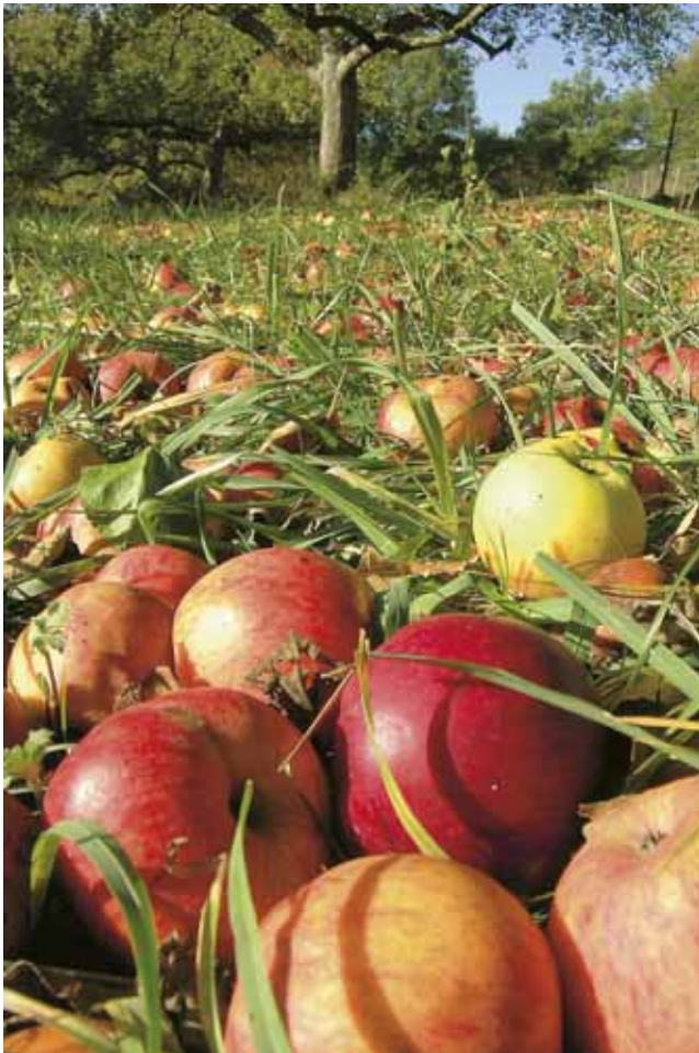
Falläpfel auf einer Streuobstwiese

Vor der Gehölzbeschaffung ist eine Abstimmung und Zusammenarbeit mit Nachbarn und anderen interessierten Grundstücksbesitzern, Naturschutzgruppen oder Heimatvereinen sinnvoll. Die Zusammenarbeit hilft Fehler zu vermeiden und Kosten zu sparen.