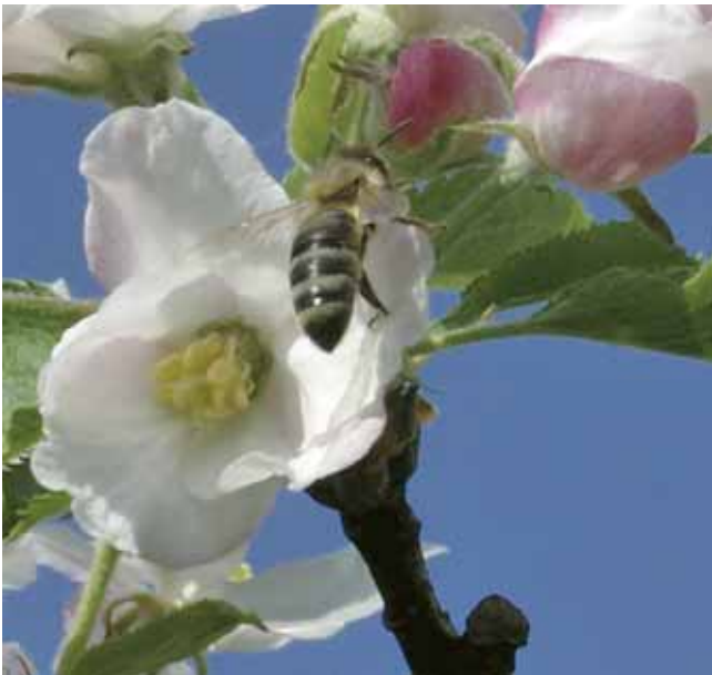
Der Blütenreichtum von Streuobstwiesen lockt zahlreiche Bienen an, die für die Befruchtung wichtig sind

Bei der Wiesennutzung sollte der erste Schnitt je nach Höhenlage nach dem Blühhöhepunkt ab Mitte Juli erfolgen und der zweite kurz vor Beginn der Obsternte im September. Zur Schonung blütenbesuchender Insekten kann die erste Mahd abschnittsweise erfolgen. Das Mahdgut sollte verwertet, gemulcht oder entfernt werden.