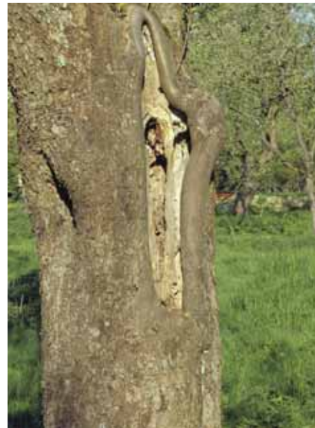
Totholz in alten Bäumen ist eine wichtige Lebensstätte für Wildbienen und andere Tiere

Auch der abgängige Obstbaum hat in dieser Phase bis zum Absterben eine große Bedeutung für den Arten- und Naturschutz. Astlöcher und Höhlungen bieten seltenen Tierarten wie dem Steinkauz Unterschlupf und auf Alt- und Totholz sind viele bedrohte Tierarten wie z. B. Bockkäfer oder Wildbienen angewiesen.