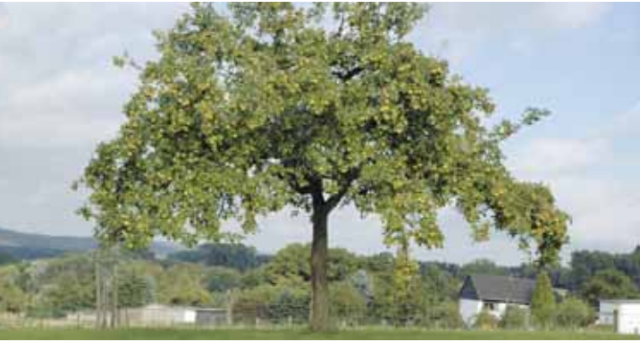
Fruchtertrag bei Äpfeln ist nur dann möglich, wenn ein geeigneter Baum als Pollenspender in der Nähe steht

Walnüsse sind übrigens immer Selbstbefruchter und können problemlos auch als Solitärbäume gepflanzt werden. Süßkirschen, die auf Fremdbestäubung angewiesen sind, werden durch wilde Vogelkirschen erfolgreich befruchtet.