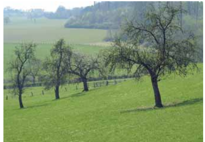
Hanglagen, an denen Kaltluft gut abfließen kann, sind für die Anlage von Streuobstwiesen geeignet

Obstbäume benötigen generell viel Licht und eine gute Durchlüftung des Bestandes. Fehlender Luftaustausch kann Pilzinfektionen wie Obstbaumkrebs begünstigen und verursachen. Beschattete Flächen sind daher für Obstwiesen ungeeignet, bei der Standortwahl ist ausreichend Abstand zum Waldrand zu halten.