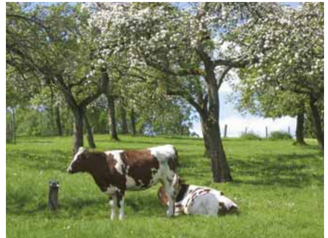
Eine extensive Beweidung ist mit Naturschutzziele gut zu vereinbaren