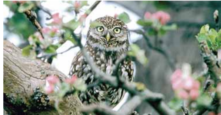
Steinkauz zur Obstblüte

Streuobstwiesen werden mit zunehmenden Alter ökologisch wertvoller, wenn regelmäßige Pflege und Nachpflanzungen für eine dauerhafte Sicherung des Bestandes sorgen. Mit Bäumen aller Altersstufen sind sie besonders abwechslungsreich und bieten zahlreichen wirbellosen Tierarten einen Lebensraum. Blüten, Blätter und Holz sind Nahrungsgrundlage vieler Insektenarten. Der Höhlenreichtum alter Obstwiesen trägt zur besonderen Bedeutung für zahlreiche Tierarten bei. Neben häufigeren Vogelarten wie Amsel, Buchfink, Star, Kohl- und Blaumeise begegnet man oft auch selteneren Arten wie Feldsperling, Grauschnäpper, Gartenrotschwanz und Grünspecht.