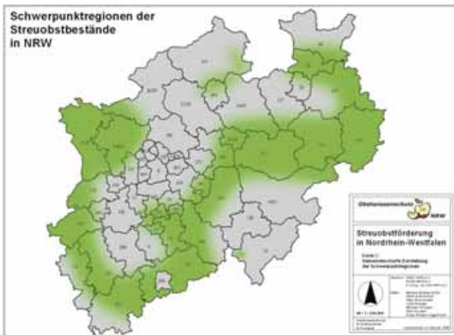
Der Streuobstgürtel von NRW zeigt die Schwerpunktregionen der Streuobstbestände des Landes

Der Streuobstbestand von NRW umfasste im Jahr 2005 mindestens 922.000 Hochstämme. Weitere Informationen und kreisweite Zahlen lassen sich den im Anhang angegebenen Internetadressen der Naturschutzverbände entnehmen.