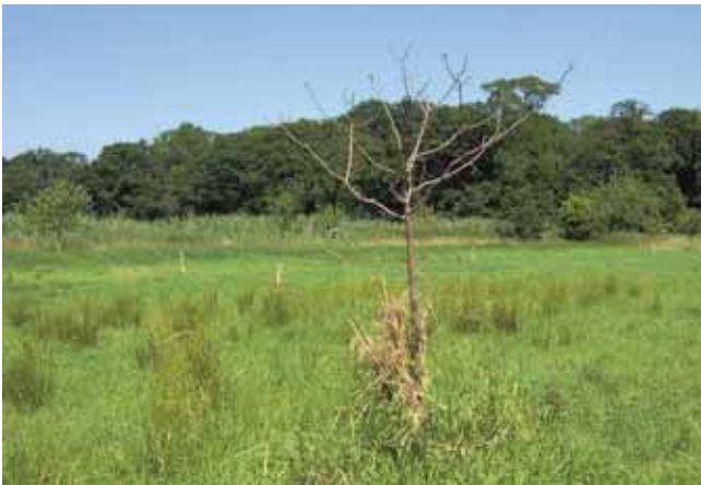
Die Binsbulke auf dem Bild zeigen Staunässe an

Talböden, feuchte bis nasse Senken und überschwemmungsgefährdete Niederungen sind ungeeignete Standorte. Die Mängel werden oft durch auftretendes Binsenwachstum und verzögerten Grünlandaufwuchs angezeigt.