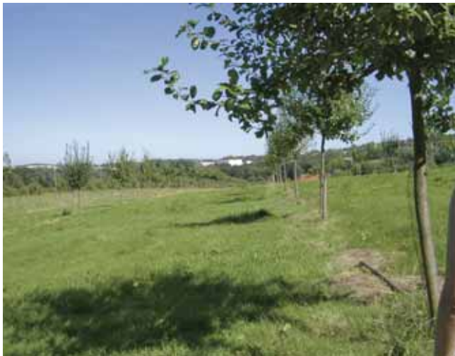
Große Streuobstanlagen im Rahmen von Ausgleich- und Ersatzmaßnahmen (A+E-Maßnahmen) benötigen dauerhafte Finanzierungskonzepte für die Baumpflege

Um den Lebensraum „Obstwiese“ langfristig zu erhalten, ist die Anpflanzung von jungen Bäumen und deren kontinuierliche Pflege unbedingt erforderlich. Von zentraler Bedeutung ist die Erhaltungspflege vitaler Altbäume.