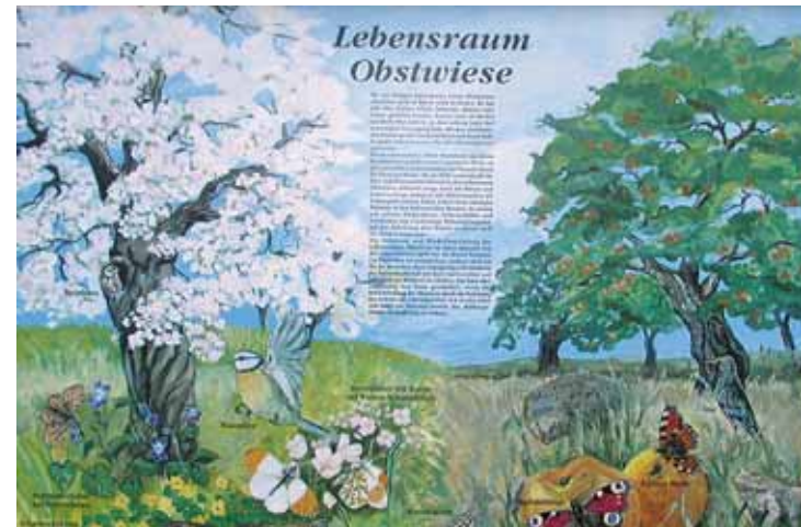
Struktur- und artenreicher Lebensraum: Die Streuobstwiese

„Die Baumzucht verschafft denjenigen, die sich damit bemühen, einen angenehmen Teil ihrer Nahrung. Sie gereicht zur Zierde eines Landes, zur Reinigung der Luft, zum Schutz und Schatten und hat überhaupt in vielen anderen Dingen ihren trefflichen Nutzen“ (Johann Kaspar Schiller, 1776)