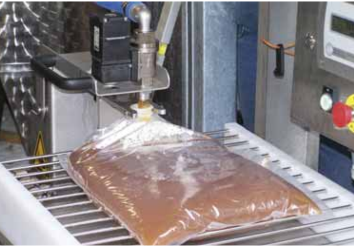
Der frisch gepresste Saft wird nach dem Pasteurisieren in Beutel abgefüllt und ist jetzt mindestens ein Jahr haltbar

Das sogenannte BAG-IN-BOX-System bietet viele Vorteile. Der Saft ist nach Anbruch mindestens zwei Monate haltbar, da keine Luft eindringen kann. Die Lagerung der Boxen nimmt weniger Platz in Anspruch als bei Flaschen, und die Kapitalbindung ist niedriger als beim herkömmlichen Flaschen- und Kastenpfand.