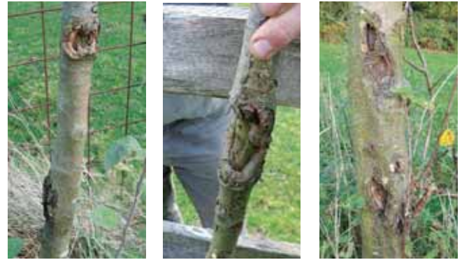
Bei diesen Schäden handelt es sich um Obstbaumkrebs, einer Pilzkrankung, die ausgeschnitten werden muss

Obstbäume benötigen generell viel Licht und eine gute Durchlüftung des Bestandes. Fehlender Luftaustausch kann Pilzinfektionen wie Obstbaumkrebs begünstigen und verursachen. Beschattete Flächen sind daher für Obstwiesen ungeeignet, bei der Standortwahl ist ausreichend Abstand zum Waldrand zu halten.