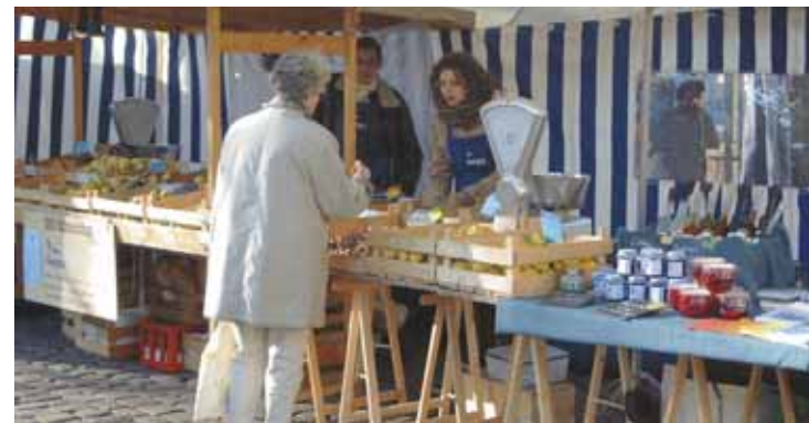
Streuobstverkauf auf dem Wochenmarkt in Münster

In NRW gibt es seit vielen Jahren zahlreiche, überwiegend ehrenamtlich tätige Naturschutzverbände und Heimatvereine, die sich zu Initiativen und Netzwerken zusammenschlossen haben und die sich in der Kooperation mit den Landwirten und sonstigen Nutzern für den Obstwiesenschutz engagieren (Adressen finden sich im Anhang).