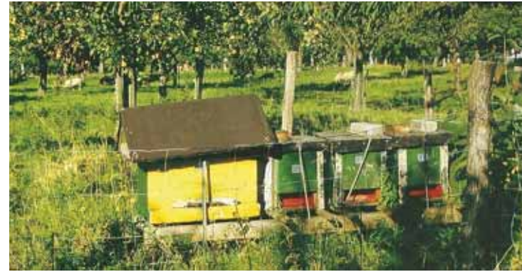
Auf Streuobstwiesen leisten Bienen bis zu 90 % der Bestäubungsarbeit

Ein wichtiges Auswahlkriterium ist auch die Reifezeit der Früchte. In den Empfehlungslisten auf den Seiten 50 - 53 sind Pflückreife-, Genussreifemonat und Haltbarkeit der Früchte angegeben. Unter Pflückreife versteht man den Erntezeitpunkt, unter Genussreife den Zeitpunkt, wenn das Obst das volle Aroma entfaltet. Pflückreife- und Genussreifezeitpunkt können identisch sein oder in Abhängigkeit von den Witterungsbedingungen und der Höhenlage differieren.