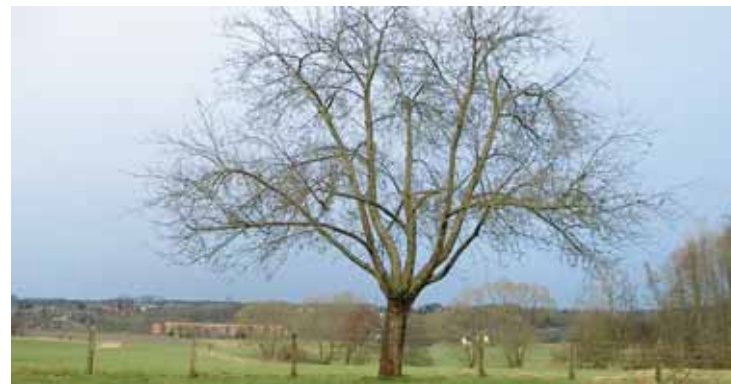
Baum vor und nach dem Schnitt sowie im Folgejahr